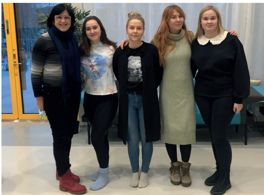
Reuniões com colegas de Humak University, UFES e Robert Gordon University