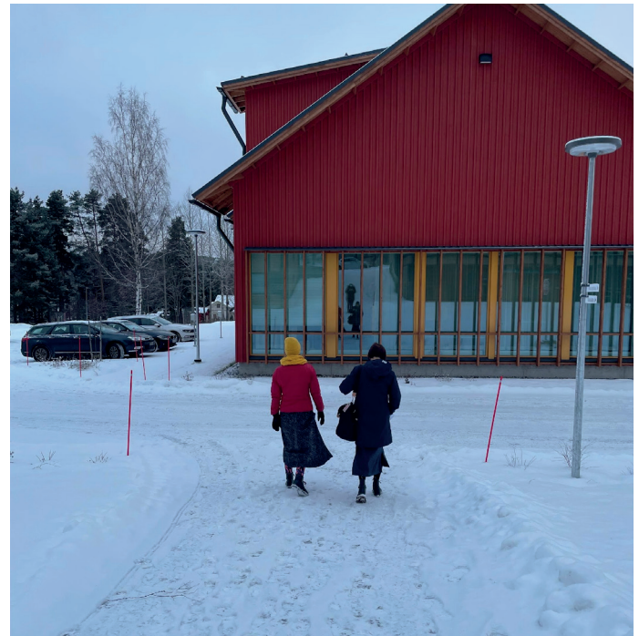
Fotos do Campus de Jyväskylä